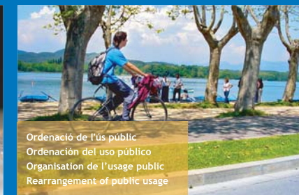
Ordenació de l'ús públic Ordenación del uso público Organisation de l'usage public Rearrangement of public usage