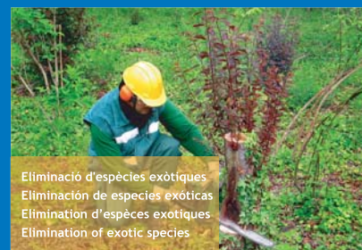
Eliminació d'espècies exòtiques Eliminación de especies exóticas Elimination of exotic species Elimination of exotic species