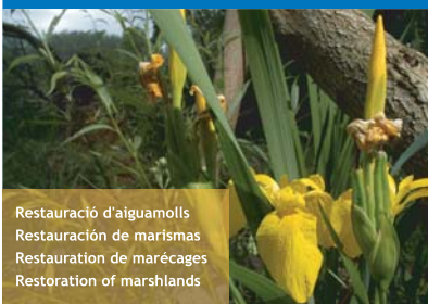
Restauració d'aigüamolls Restauración de marismas Restoration of marshes Restoration of marshlands