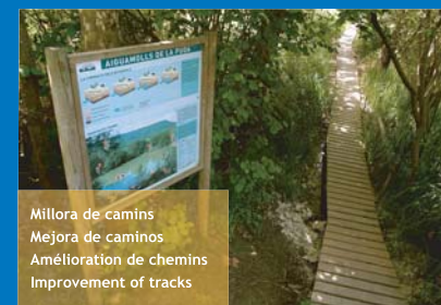
Millora de camins Mejora de caminos Amélioration de chemins Improvement of tracks